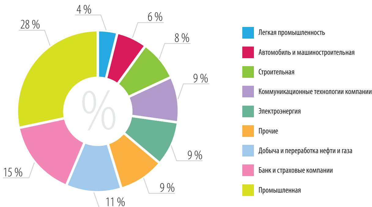
Рис. 2. Распределение сфер деятельности наиболее крупных китайских корпораций в рейтинге Fortune Global 500 в 2015 г. Примечание: разработано на основе [9].

Для Китая инвестирование в страны Восточной и Юго-Восточной Азии облегчается меньшими языковыми и культурными барьерами, по сравнению с другими регионами мира, в силу проживания в нем разветвленной китайской диаспоры.