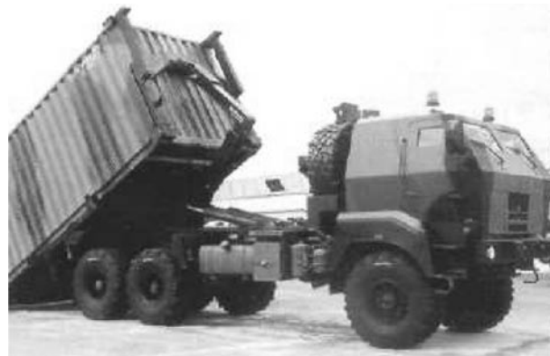
Рис. 2. Машина с платформой и подъемным механизмом от гидропривода

Военные России также не обошли вниманием машины со сменными кузовами. В 2006 г. на выставке в подмосковных Бронницах демонстрировались «мультилифты» на полноприводных КамАЗах и «Уралах» грузоподъемностью 14 и 18 т с кузовами всех типов —