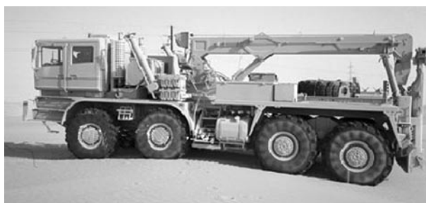
Рис. 1. Автоэвакуатор МЗКТ-790986

В Вооруженных Силах Республики Беларусь имеются различные подвижные средства технического обслуживания и ремонта, смонтированные на базовых шасси автомобилей советского производства (ЗИЛ-131, ГАЗ-66 и др.), которые морально и технически устарели, с момента выпуска не претерпевали изменений и преиму-