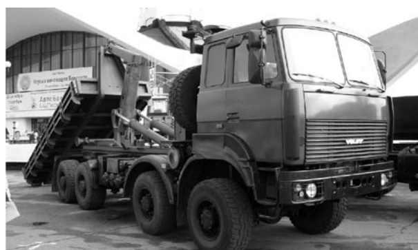
Рис. 4. Тягач МЗКТ-73011, оборудованный системой «мультилифт» МПР-2

Нами предлагается создать новые мобильные универсальные ремонтно-эвакуационные средства, которые позволят с помощью одних и тех же автомобилей проводить эвакуацию и перемещение ремонтных мастерских (кузовов-контейнеров) в новые районы развертывания, объединить разрозненные эвакуационные и ре-