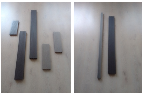
Декинг, штакетник, лага из ДПК