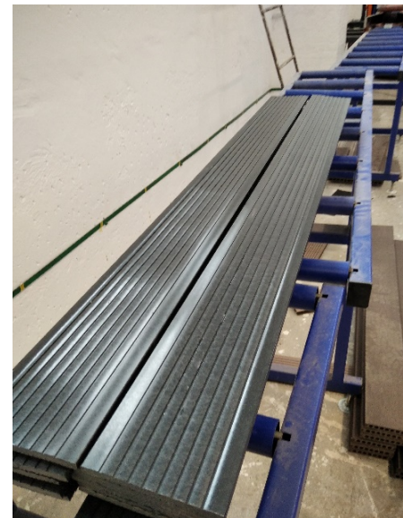
Экструзия штакетника из ДПК