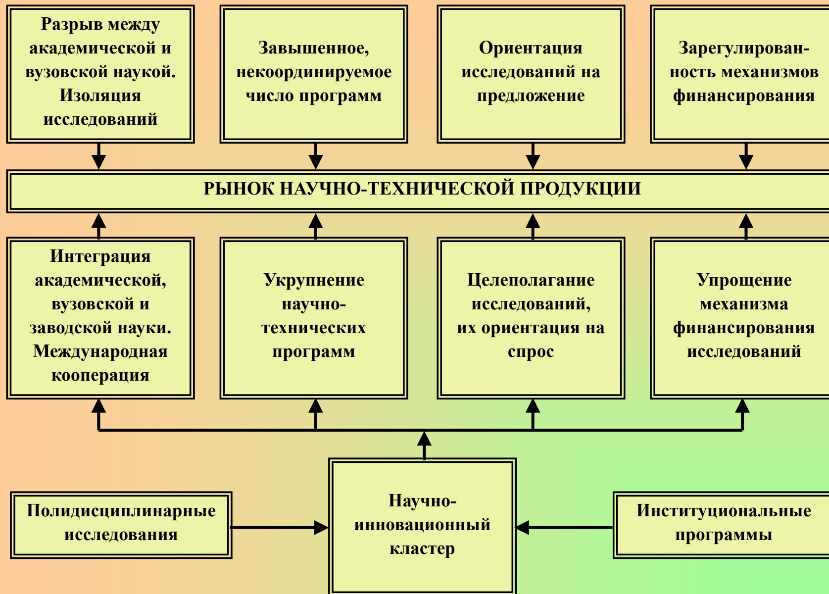
Рисунок 4 - Механизм компенсации негативных факторов рынка научно-технической продукции.